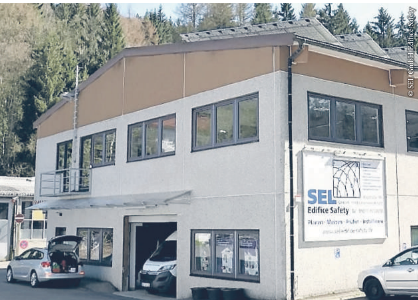
Der Elektrobetrieb SEL hat ein Büro in Warmensteinach (siehe oben) und in München.